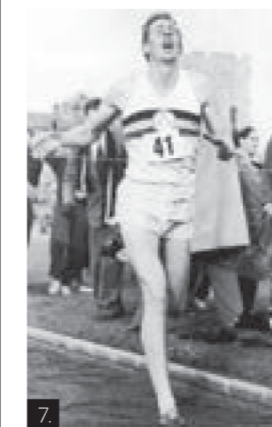
7. 7 loddrett: Han var den første som klarte bragden å løpe en engelsk mil under 4 minutter.